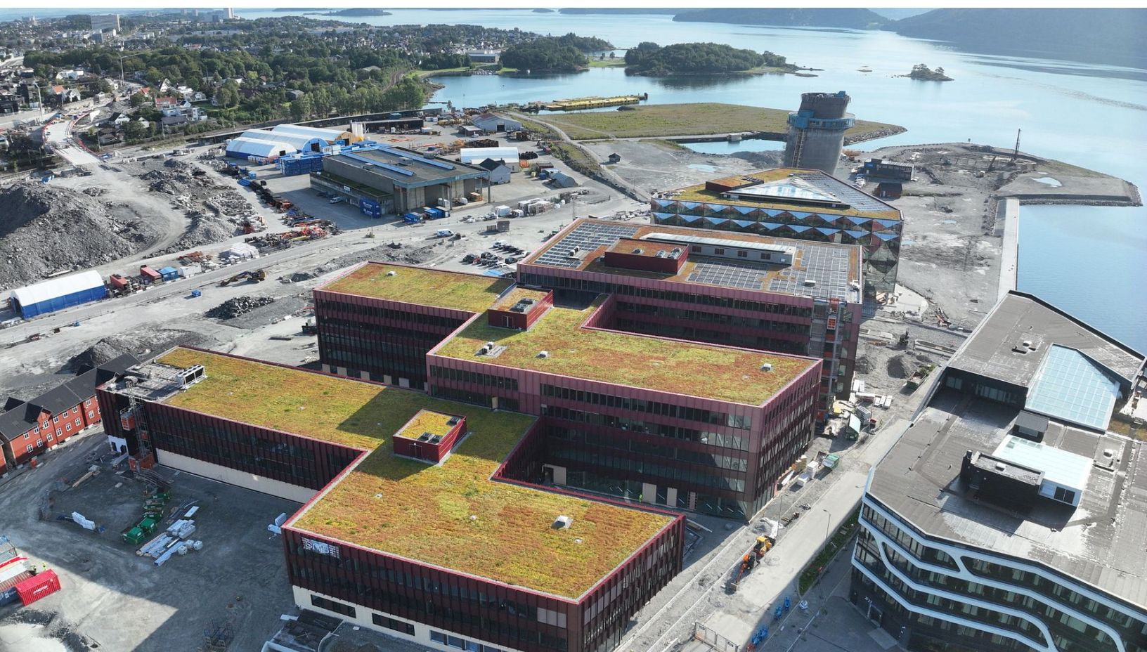
GNIST-byggene i Hinna Park